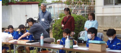
校長先生・教頭先生も応援に