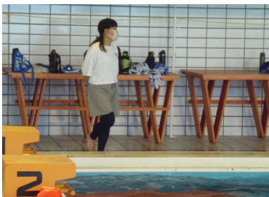
見守る目が温かいです。

久賀小学校の水泳学習は取手聖徳高校のプールで行います。子供たちはバスで学校から移動しましたが、KOSサポーターの皆さんは現地で子供たちを迎えていました。水泳学習は入水後の安全確認はもちろん、前後の準備、片付けに大人の手助けが必要です。帽子を被る、ゴーグルをかける等々、子供たちには案外難しいようで、この日も何度も「ゴーグルを直して!」とサポーターさんに駆け寄る児童の姿がありました。先生方も「多く目で見守っていただけるのは本当に安心です。」と笑顔で話していました。