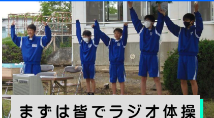
まずは皆でラジオ体操

藤代中学校1年生による地域ボランティア活動の第2弾は久賀公民館主催の「ペタンク大会」です。ペタンクとは、ヨーロッパ発祥のスポーツで、コート上で金属のボールを投げ合い、目標に近付けて得点するというもの。地元の16チームが参加した大会に、5人の生徒が「進行係」「計時係」「得点係」として協力しました(5/23)。