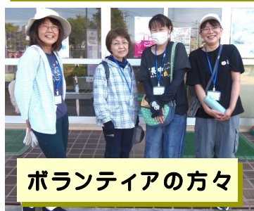
ボランティアの方々