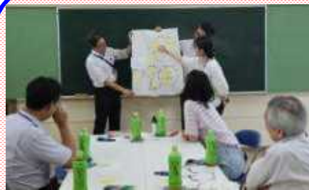
グループで話し合ったことを発表／皆で共有