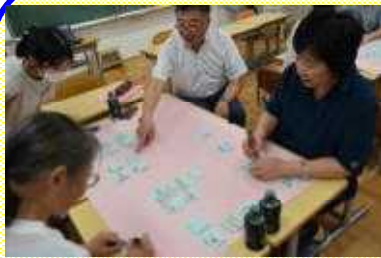
校長先生と一緒に話し合い（熟議）

「学校運営協議会」の委員をしています。学校行事や授業を参観して子供たちの様子を直接見ながら、これからの学校のあり方、地域との協働体制について話し合っています。校長先生のお考えも直接伺うことができ、委員として責任をもって取り組んでいるつもりです。様々なお立場の他の委員の皆さんの考えを聞くこともでき、皆で力を合わせて子供たちを育てていこうという気持ちが高まりました。