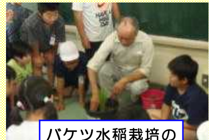
バケツ水稲栽培の講師（寺原小）