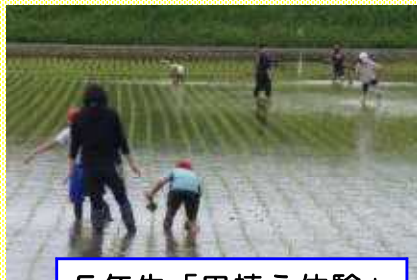
5年生「田植え体験」のお手伝い（久賀小）