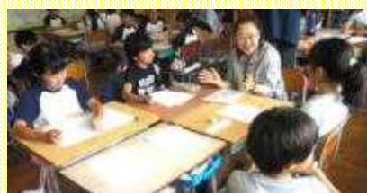
取手市について3年生からの質問に答える（取手西小）