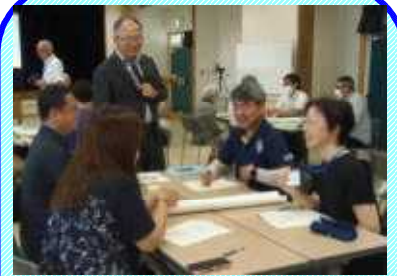
文部科学省の講師と年4回の全体研修