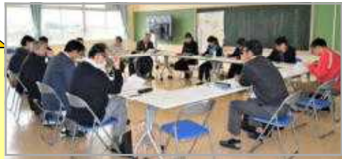
学校運営協議会のようす

協議会は年4～5回開催され、校長先生・教頭先生・教務主任の先生たちと話し合いをします。