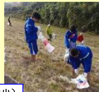
小貝川のクリーン作戦（藤代中一年生）