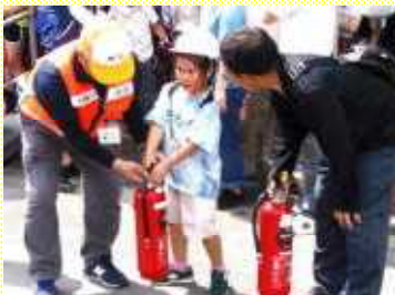
地域の防災組織と「親子防災教室」（六郷小）