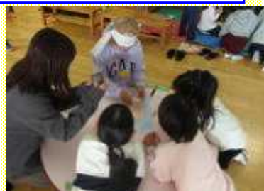
学校のおまつりで「昔遊び」（永山小）