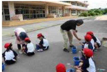
種を一人一人に配っています（1年）