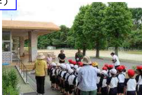
お礼のあいさつ（1年）

1年生「アサガオのたねをまこう」2年生「大きくそだてわたしのトマト」の活動です。講師とボランティアの方々計4名で丁寧に教えていただきました。早く育てほしいとの願いをこめて活動しました。