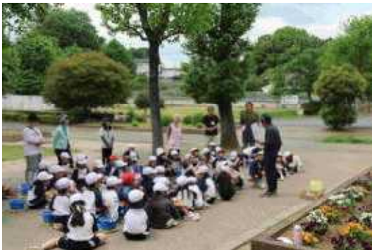
講師の先生のお話（2年）