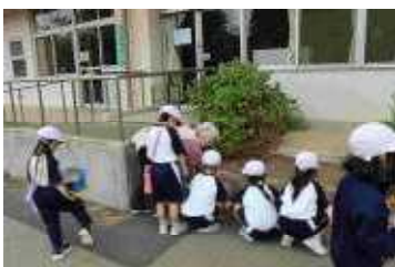
組ごとに鉢並べ（2年）