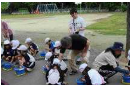
位置の確認と種まき（2年）