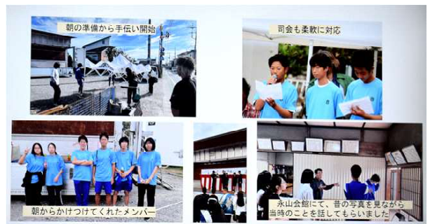
永山フェスティバルでの永山中生