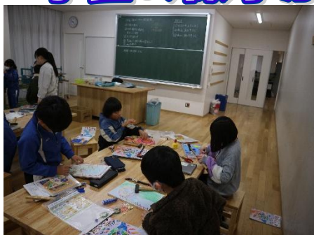
3年生 図工金槌を使つての制作