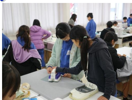
5年生家庭科エプロン制作