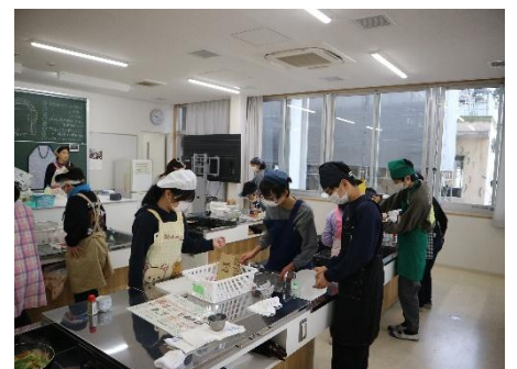
6年生家庭科調理実習